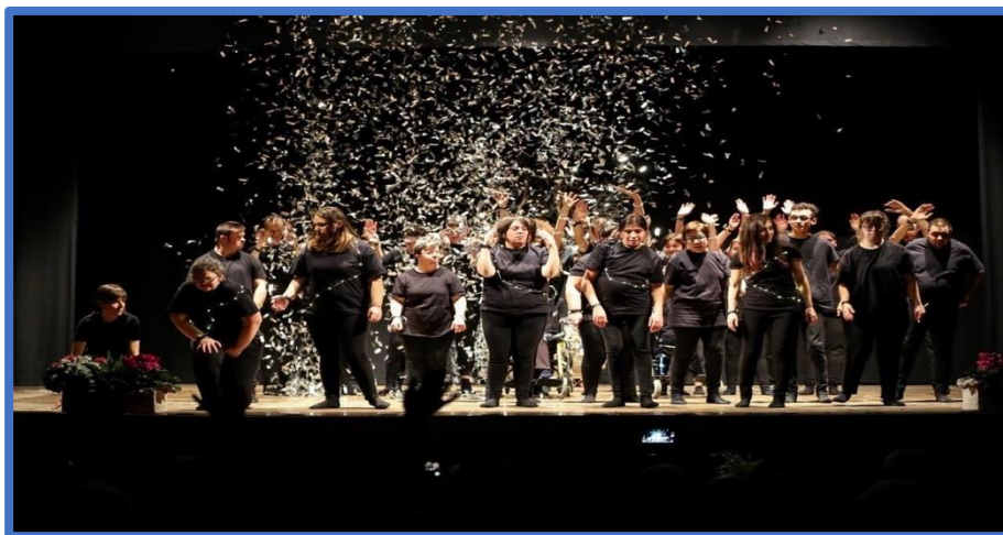
Mantova, Teatro Bibiena - Spettacolo 'Desider... io'

espressività del sé. L'attività teatrale permette all'utente di sperimentare capacità nuove di comunicazione attraverso il linguaggio verbale e corporeo, arrivando a fine percorso ad esprimere le loro storie ed emozioni.