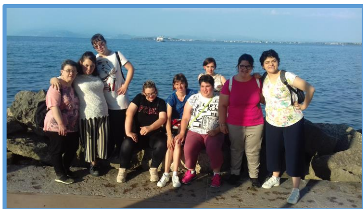
Desenzano: uscita serale con shopping e pizza risocializzante

Alcuni obiettivi vengono sperimentati in situazioni reali come occasioni di integrazione sociale. In questo ambito rientrano le uscite (in pizzeria, al bar, a concerti e in gita), la pet therapy, la piscina, i giochi motori, il teatro e i tirocini risocializzanti.