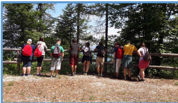
Pinzolo: soggiorno estivo montano

Il soggiorno climatico offre inoltre alla famiglia un momento di sollievo, anche se per un periodo breve, dalla gestione quotidiana del proprio congiunto.