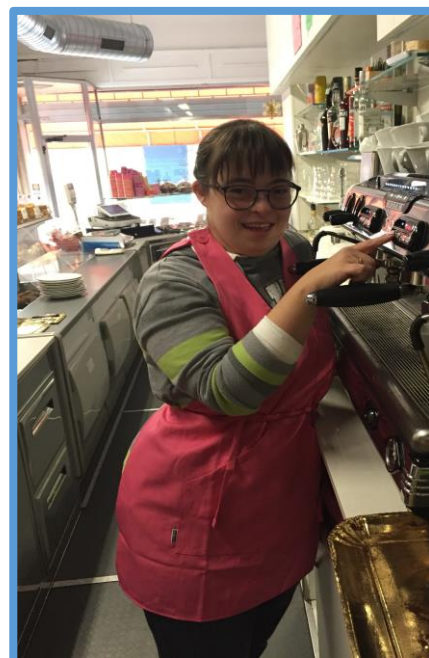
Esempio di tirocinio