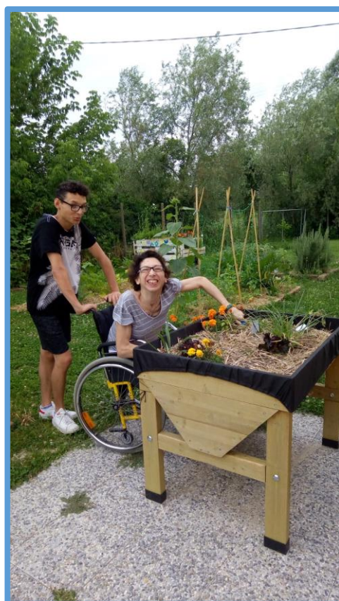
Attività di orto