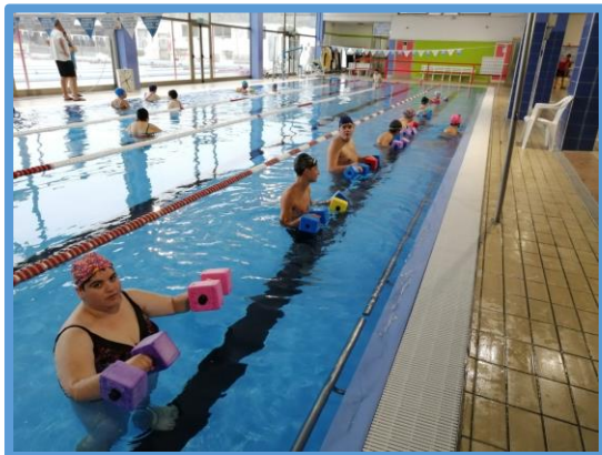
Attività motoria in piscina

Sotto varie forme si propone agli utenti di essere coinvolti in esperienze di attività motoria, con lo scopo di mantenere la muscolatura funzionale, migliorare e/o mantenere situazioni compromesse, conoscere il proprio schema corporeo e rispettare le regole dei giochi a squadre.