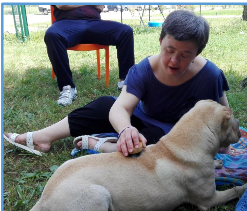
Attività di Pet Therapy

L'attività è gestita da un educatore con preparazione specifica.