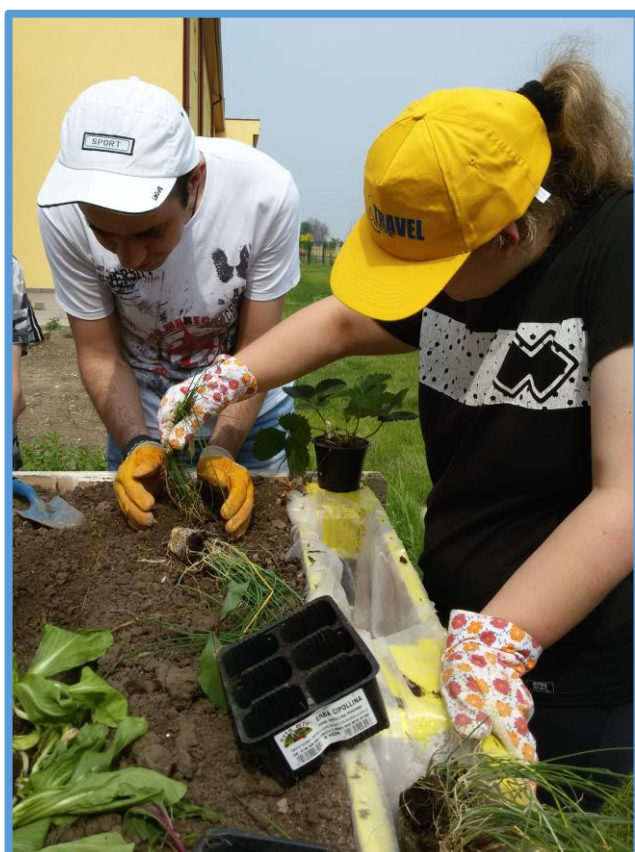
Attività di giardinaggio