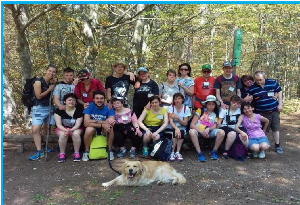
Soggiorno estivo a Folgaria