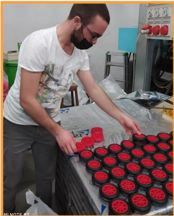
Attività di assemblaggio