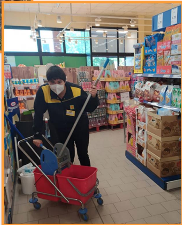
Esperienza lavorativa in un supermercato