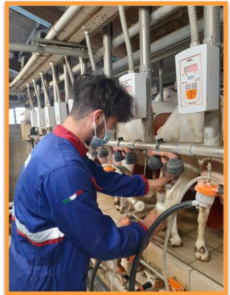
Tirocinio in un'azienda agricola