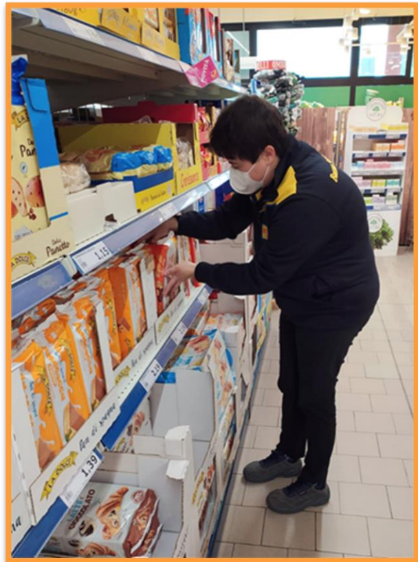
Tirocinio in un supermercato

parallelamente alle attività educative interne, offriamo la possibilità di sperimentarsi in contesti lavorativi esterni allo SFA, senza la presenza continua dell'educatore, che verificherà periodicamente il tirocinio attraverso colloqui con il tutor e l'utente.