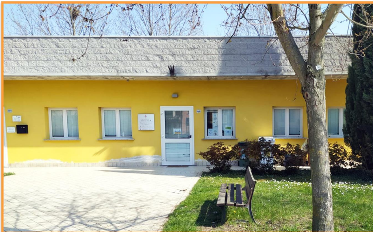
Sede del Servizio di Formazione all'Autonomia Castelnuovo di Asola

Segreteria Cooperativa Agorà: 0376 957001